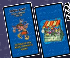
13 КАРТ АРТЕФАКТІВ