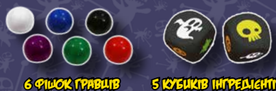
6 ФІШОК ГРАВЦІВ